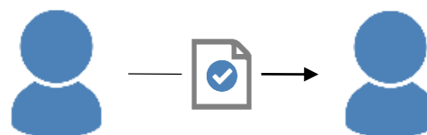
Figur 2: "Modtagne godkendelser" ser på data relativt til afsendelse og modtagelse af godkendelser.

Den primære forskel mellem de to perspektiver er, hvordan data associeres med den enkelte godkender i forløbet, som illustreret i figurerne ovenfor. Dette er især vigtigt i forhold til beregning af tidsforbrug: Eksempelvis vil den gennemsnitlige fristoverholdelse for en "Godkendelse" være beregnet efter mængden af tid, godkenderen havde til fristen ved modtagelsen af godkendelsen. For en "Modtagen godkendelse" vil gennemsnittet være beregnet efter mængden af tid til fristen efter afsendelsen – med andre ord, mængden af tid modtageren havde til fristen ved modtagelsen af godkendelsen.